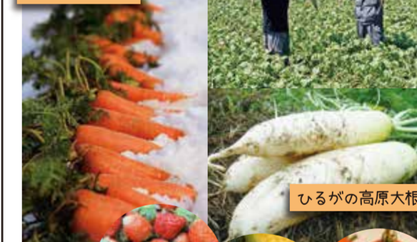
ひるがの高原大根