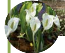
ミスバショウ群生地 4月下旬～5月上旬