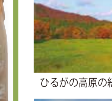
ひるがの高原の紅葉 10月中旬～11月上旬