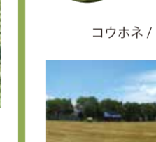
ひるがの湿原植物園 コウホネ/ヒツジグサ/キンコウカ