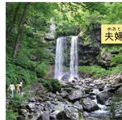
のあてだき 夫婦滝

開拓される前の状態で湿原を保護している。ワタスゲ・キンコウカをはじめ、湿原の植物が数多く見られる。華やかではないけれど、小さくてかわいい花をつける湿原植物。園内で探して歩くのも楽しい。●維持協力金 100円 ●開園期間 / 4月下旬～10月上旬 ●0575-73-2241