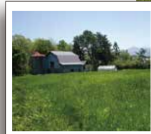
初めてなのに 懐かしくなる景色。