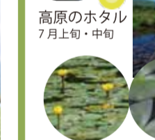
高原のホタル 7月上旬・中旬