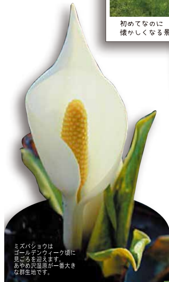
ミスバショウは コルデンウィーク頃に 見ごろを迎えます。 あやめ沢温泉が一番大きな 群生地です。