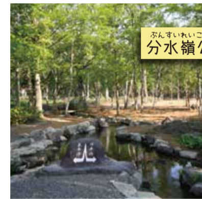
ぶんすいらいこうえん 分水嶺公園

大日ヶ岳の麓から湧き出た水が山を流れ、ここで長良川と庄川に分かれていく分岐点。それがこの分水嶺。国道からすぐの場所で見られる分水嶺は全国的にも珍しい。公園の奥には木道が整備され、GW頃にはミスバショウが楽しめる。