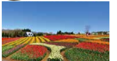
牧歌の里のチューリップ 5月上旬