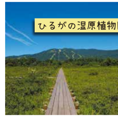
ひるがの湿原植物園

大日ヶ岳の麓から湧き出た水が山を流れ、ここで長良川と庄川に分かれていく分岐点。それがこの分水嶺。国道からすぐの場所で見られる分水嶺は全国的にも珍しい。公園の奥には木道が整備され、GW頃にはミスバショウが楽しめる。