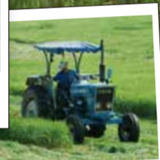
見ているだけで わくわくする光景。